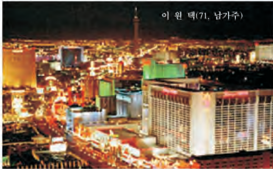
이 원 택(기, 남가주)